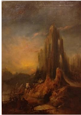
Embarcadeiro de negros