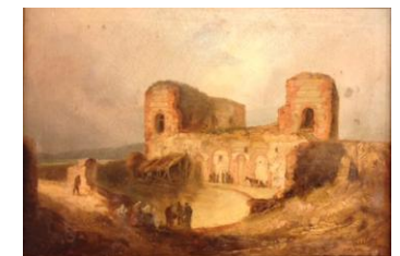
Palacio de Galiana (1849) 38 x 54'5 cm