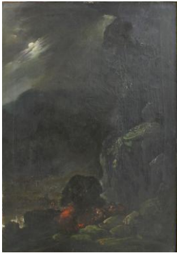
Ataque a un convoi