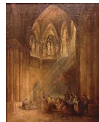
Interior dun templo 56 x 44'3 cm

No cadro Palacio de Galiana o artista representa as ruínas dun edificio mudéxar situado en Toledo, que foi reconstruído nos anos 60 do s. XX e que tamén debuxou para unha das litografías da España Artística e Monumental . O encadre e a disposición das figuras acentúan a concepción escenográfica que singulariza moitas das súas obras.