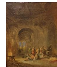
Cadro dos xitanos (1852) 40 x 33'8 cm